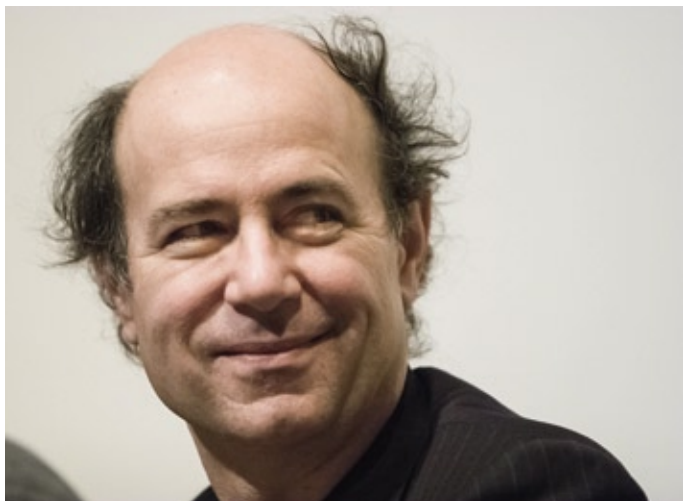
2004. gada Nobela prēmijas fizikā laureāts profesors Frenks Vilčeks

Viņam ir jābūt gatavam izmantot iespējas, kolīdz tās uzrodas. Gribot negribot man nācās atzīt, ka kvarku konfainmenta problēma, ko vēlējos atrisināt, ir pārāk sarežģīta. Lai vispār virzītos uz priekšu, man vajadzēja krietni nolaist latīņu un apsvērt šaurāku problēmu risināšanu. (Vēlāk paskaidrošu, ka galu galā man izdevās dot zināmu ieguldījumu kvarku konfainmenta problēmas risināšanā, tomēr vajadzēja pāriet gandrīz divdesmit gadiem.)